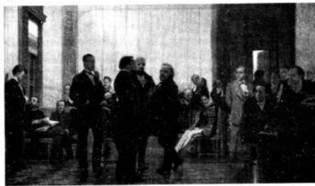
Картина И. Репина «Славянские композиторы»

Конечно, новаторство Глинки не было полностью оценено современниками. Высокопоставленные слушатели на премьере свистели, шикали. Великий князь своих адъютантов вместе гауптвахты отправлял в театр на представления «Руслана и Людмилы». Но сам Глинка говорил: «Я верю, что пройдет время, может, сто лет, и мою оперу поймут и оценят». Он был прав. История закрепила за ним первенство в создании сказочно-эпического жанра в русской опере.