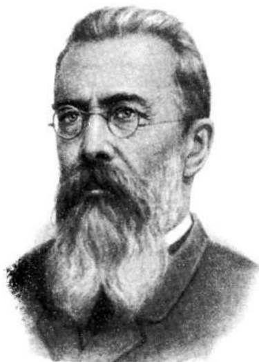
Николай Андреевич Римский-Корсаков 1844—1908

67 романсов, в том числе циклы «Детская», «Без солнца», «Песни и пляски смерти».