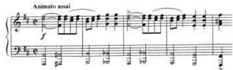
Пример № 31

ховых инструментов, похожие на народные пляски.