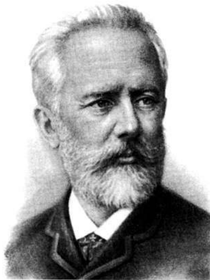
Петр Ильич Чайковский 1840—1893

79 романсов, вокальные дуэты и трио и др.