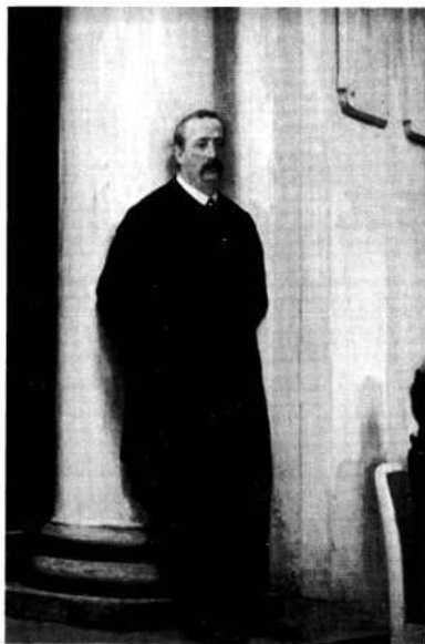
Александр Порфирьевич Бородин 1833—1887