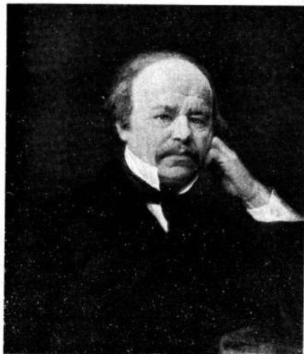
Портрет А.С. Даргомыжского

во время работы Даргомыжского над новой оперой по трагедии А.С. Пушкина «Каменный гость». Эта опера являет собой уникальный пример в истории музыки. Либретто для нее послужило литературное произведение — маленькая трагедия Пушкина, в которой композитор не изменил ни одного слова. Страдая тяжелым сер-