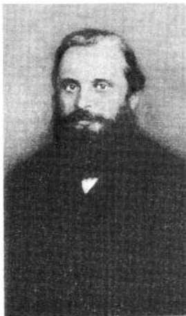
Портрет М.А. Балакирева

Так называлось творческое содружество композиторов, возникшее на рубеже 50—60-х годов. Оно было известно также под названием Балакиревский кружок, или Новая русская