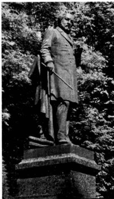
Памятник Глинке в Смоленске