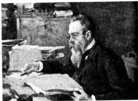
Н. А. Римский-Корсаков

бессмертный», «Сказание о невидимом граде Китеже», «Сказка о Золотом петушке». За год до смерти композитор в последний раз выступал как дирижер в Русских симфонических концертах, организованных Дягилевым в Париже. Весной 1908 года его начала беспокоить сердечная болезнь, но он продолжал работу над учебником «Основы оркестровки». Последние записи сделаны им 7 июня. А в ночь на 8 июня композитора не стало.