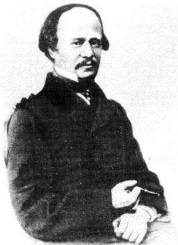
Александр Сергеевич Даргомыжский 1813—1869