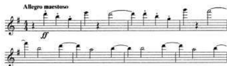
Пример № 75

Ярко, колокольно-празднично заканчивается эта симфония. Финал ее стал прообразом целого ряда подобных финалов симфоний Чайковского.