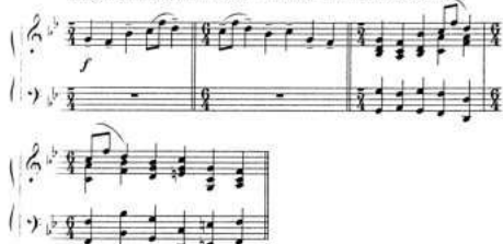
Пример № 58

Allegro giusto, nel modo russo, senza allegrezza, ma poco sostenuto