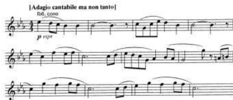
Пример № 73

Ее, как легкое дуновение ветерка, пробежавшую по озерным волнам рябь, сопровождают флейты. Потом со своей мелодией вступает фагот. И вот уже два голоса — высокий мальчишеский и мужской — поют каждый свою песню, согласно сливаясь. Прихотливо переплетаются голоса. Их мощный хор подхватывает песню, ведет ее дальше. И вот взмывает ввысь могучая народная песня. Закончен рассказ.