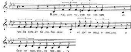
Пример № 12

Среди романсов этого периода можно выделить балладу «Ночной смотр» на стихи Жуковского. Во Франции существует легенда о Наполеоне, которой встает по ночам из гроба и делает смотр своим войскам. Музыка баллады создает картину призрачного, фантастического ночного парада. Использование жанра военного марша, который у нас вызывает воспоминания о боевых походах, доблести, подвигах, придает романсу характер романтического воспоминания верности воинскому долгу.