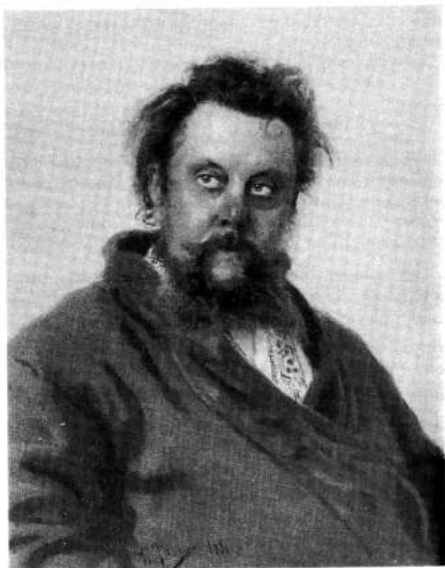
Портрет М.П. Мусоргского работы И. Репина

чили военных, стало возможным только оформив его как «вольнонаемного денщика ординатора Бертинсона». Здесь прошли последние дни Мусоргского, в течение которых И. Репин писал свой знаменитый портрет, отразивший глубокие душевные муки композитора.