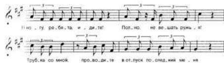
Пример № 23

романсе «Старый капрал» на слова Курочкина из Беранже. Композитор определил жанр романса как «драматическая песня». Это — и монолог, и драматическая сцена одновременно. Хотя в стихотворении Беранже говорится о французском солдате, участнике походов Наполеона, такая судьба была и у многих русских воинов. Текст романса — обращение старого солдата к товарищам, ведущим его на расстрел. Как ярко раскрыт в музыке внутренний мир этого простого, мужественного человека. Он осоробил офицера, за что был приговорен к смертной казни. Но это было не просто оскорбление, а ответ на нанесенную старому солдату обиду. Этот романс — гневное обвинение общественного строя, который допускает насилие человека над человеком.