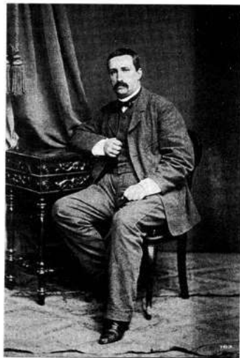
Портрет А.П. Бородина

ный бал. Бородины с удовольствием принимали в таких вечерах участие. Александр Порфирьевич любил танцевать, быстро становился душой общества, умел рассказывать веселые истории, остроумные шутки. Около полуночи он подошел в группе беседующих, присоединился к их разговору. И вдруг, на полуслове, упал. Его даже не успели подхватить. Среди присутствующих было много врачей, но сделать они