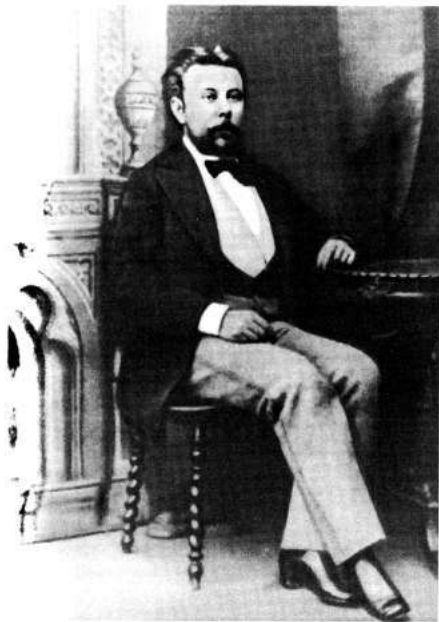
Модест Петрович Мусоргский 1839—1881