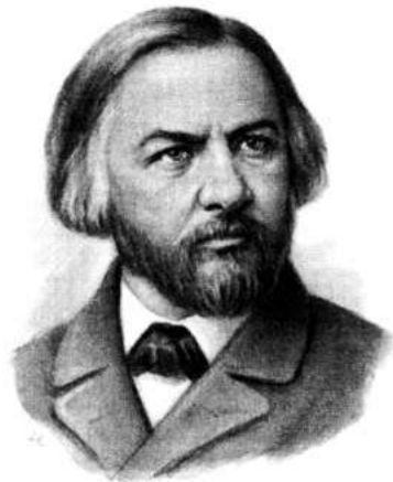
Михаил Иванович Глинка 1804—1857