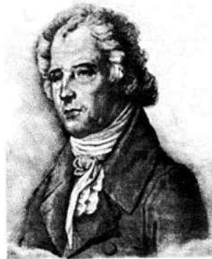
Портрет композитора Д.С. Бортнянского (1751—1825)

Самым универсальным композитором своего времени стал Дмитрий Степанович Бортнянский . Он — классик хоровой музыки, автор трех опер, произведений для фортепиано, инструментальных ансамблей.