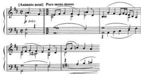
Пример № 32

Совсем другой характер имеет тема побочной партии. Она близка лирическим песням русского народа. В ней выражаются лирические чувства не одного человека, а целой массы народа. А еще она как будто рисует раздольную русскую степь.