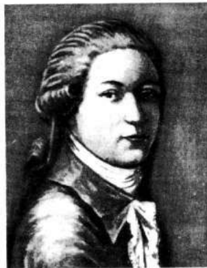
Портрет композитора Е.И. Фомина (1761—1800)

Е. Фомин родился в 1761 году в Петербурге. Его отец был солдатом-канониром Тобольского полка. В 6 лет мальчика отдали учиться в Академию художеств, где он получил музыкальное образование. Академию он закончил блестяще. Сохранились документы, в которых сказано, что за превосходные успехи в музыке Фомин, в виде исключения, получил денежную награду, хотя по уставу академии наград музыкантам не полагалось. В 1782 году он был направлен для продолжения образования в Италию. В Болонье он учился у прославленного композитора и теоретика падре Мартини. Талант Фомина получил достойную оценку за рубежом: на его долю выпала редкая честь быть