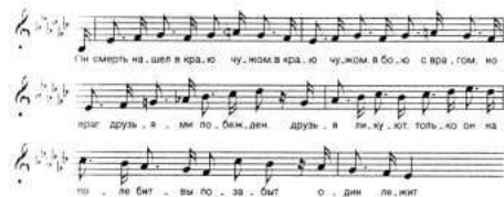
Пример № 56

Авторы раздвинули рамки сюжета. Когда мы слушаем это произведение, в нашем сознании рождается образ молодой жены убитого солдата, в далекой деревне ожидающей его возвращения. Но вернуться ему не суждено. Песня завершается трагической фразой: «А тот застал один лежит».