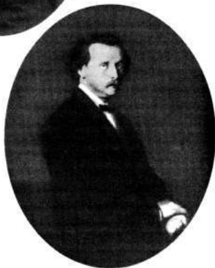
Портреты А.Г. и Н.Г. Рубинштейнов

открыта первая в России консерватория. Ее первым директором стал А. Рубинштейн. Вскоре, в 1866 году открылась Московская консерватория, которую возглавил брат А. Рубинштейна Николай Григорьевич. Обе они стали настоящим центром музыкального образования и просвещения. Из стен их вышли несколько поколений выдающихся русских музыкантов.