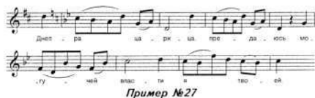
Пример № 27

В этой музыке не только отчаяние, но и решимость отомстить за себя. Наташа бросается в Днепр.